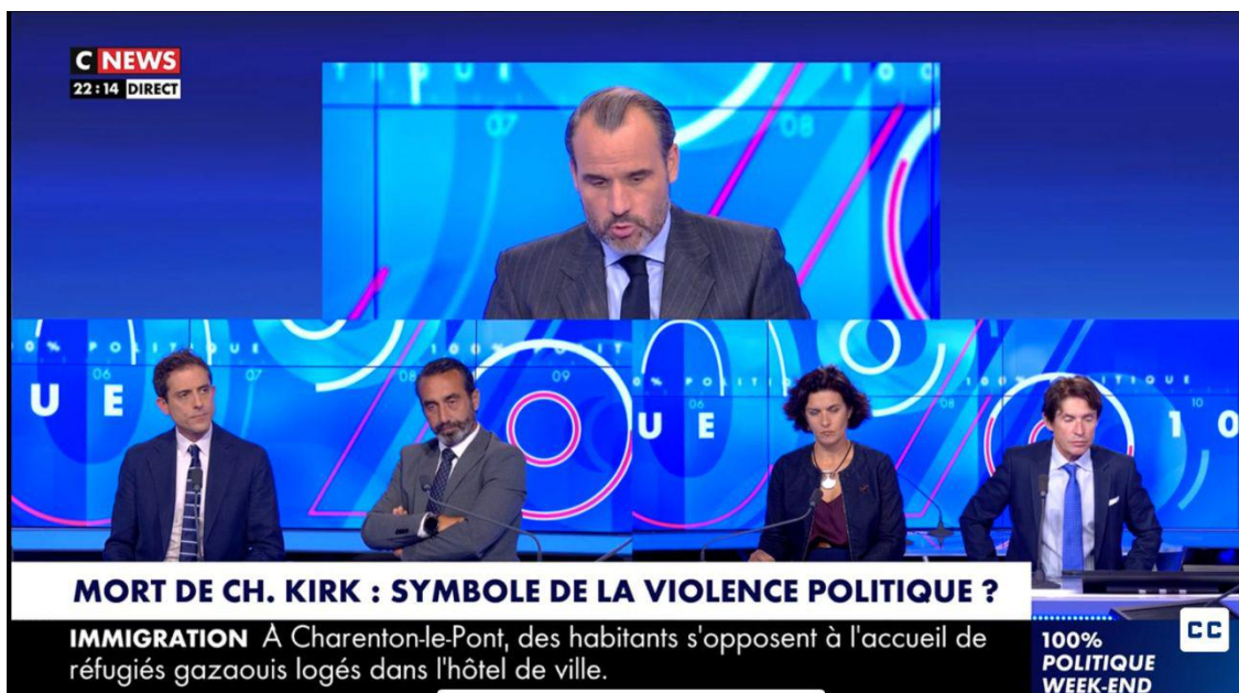
Le bandeau diffusé sur CNews, le 12 septembre dernier, relayant la fake news d'un hébergement de réfugiés gazaouis dans l'hôtel de ville de la commune du Val-de-Marne.